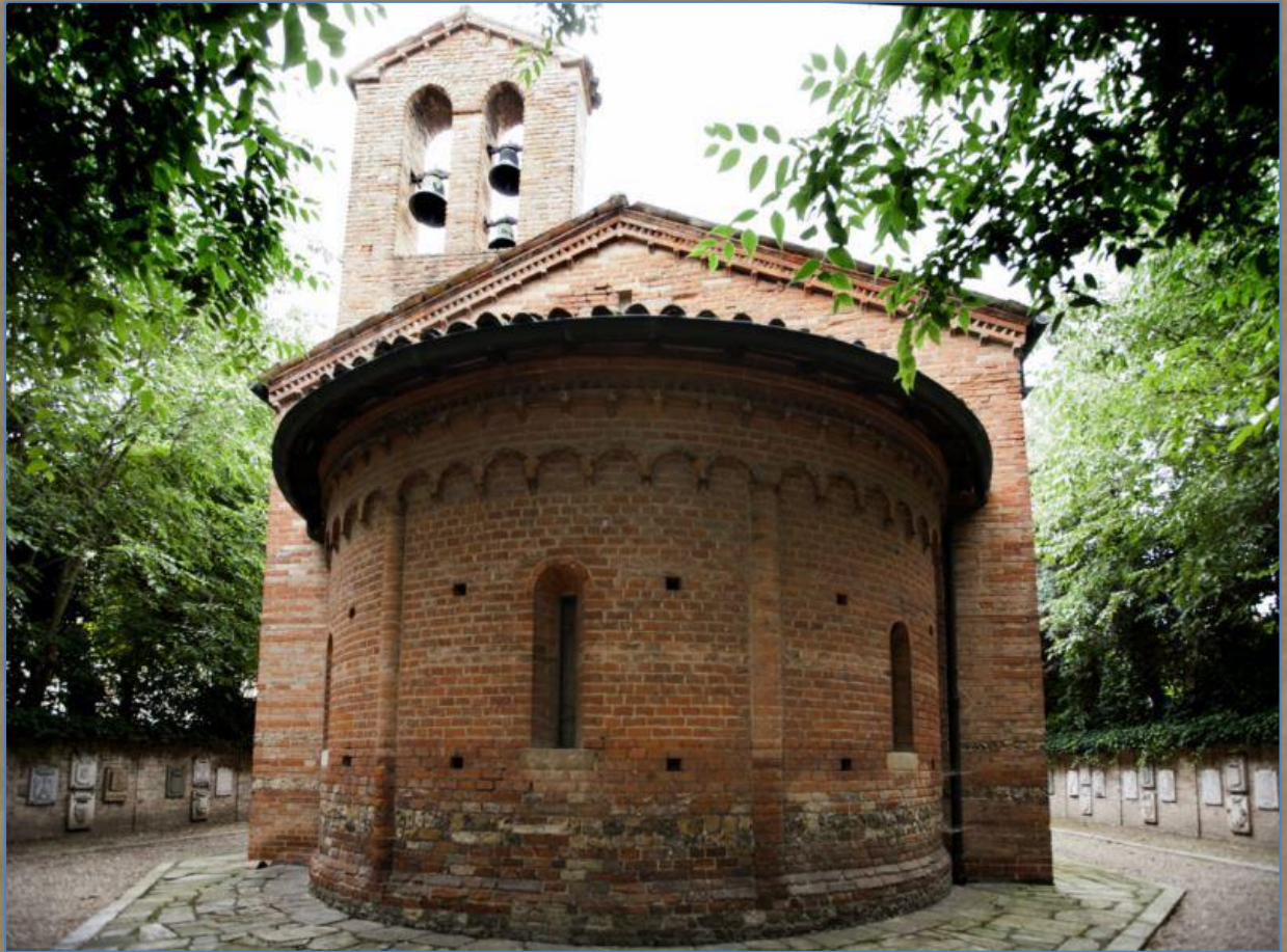
Abside del Tempio.